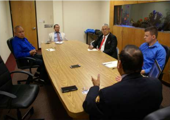
REUNION DE DIRECTIVA DE CAPELLANES