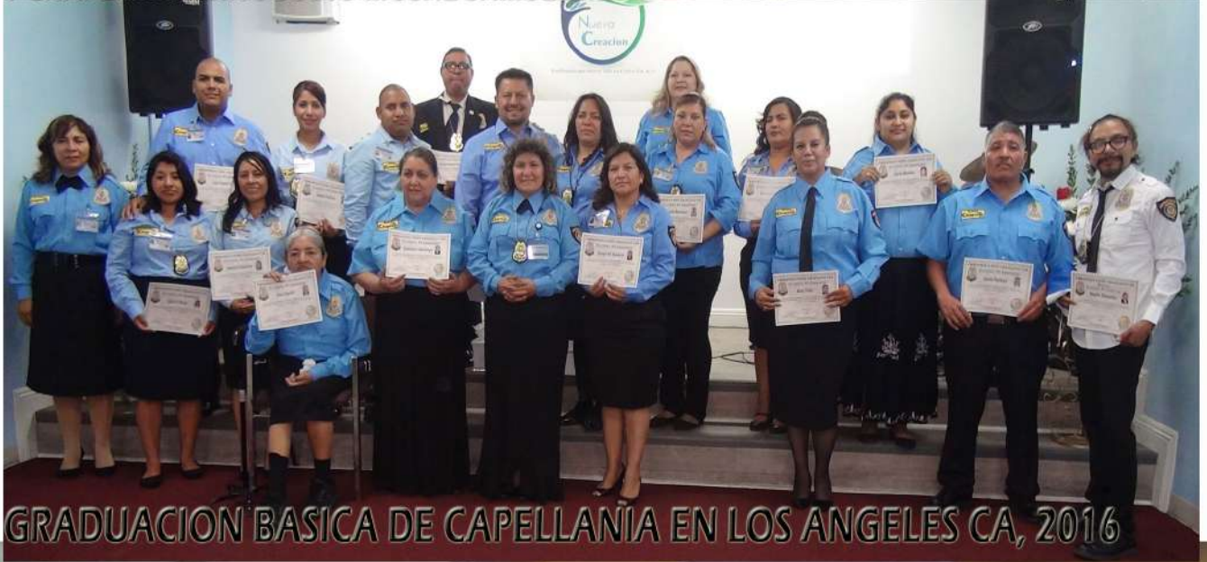
GRADUACION BASICA DE CAPELLANIA EN LOS ANGELES CA, 2016