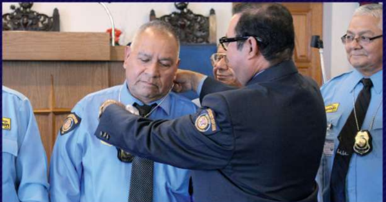
ENTREGANDO UNA PLACA A UNO DE LOS PASTORES CAPELLANES DE LA ASOCIACIÓN, COORDINADOR DE ZONA.