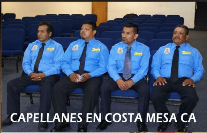
CAPELLANES EN COSTA MESA CA