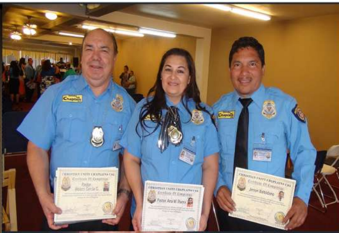
GRADUACION 2016 EN FONTANA CA.