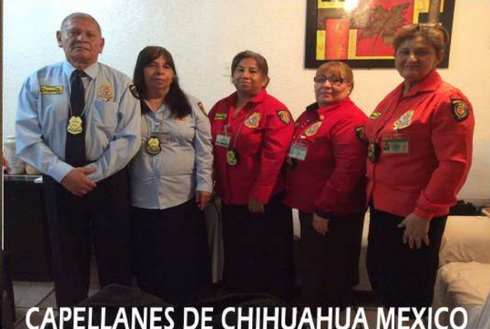
CAPELLANES DE CHIHUAHUA MEXICO