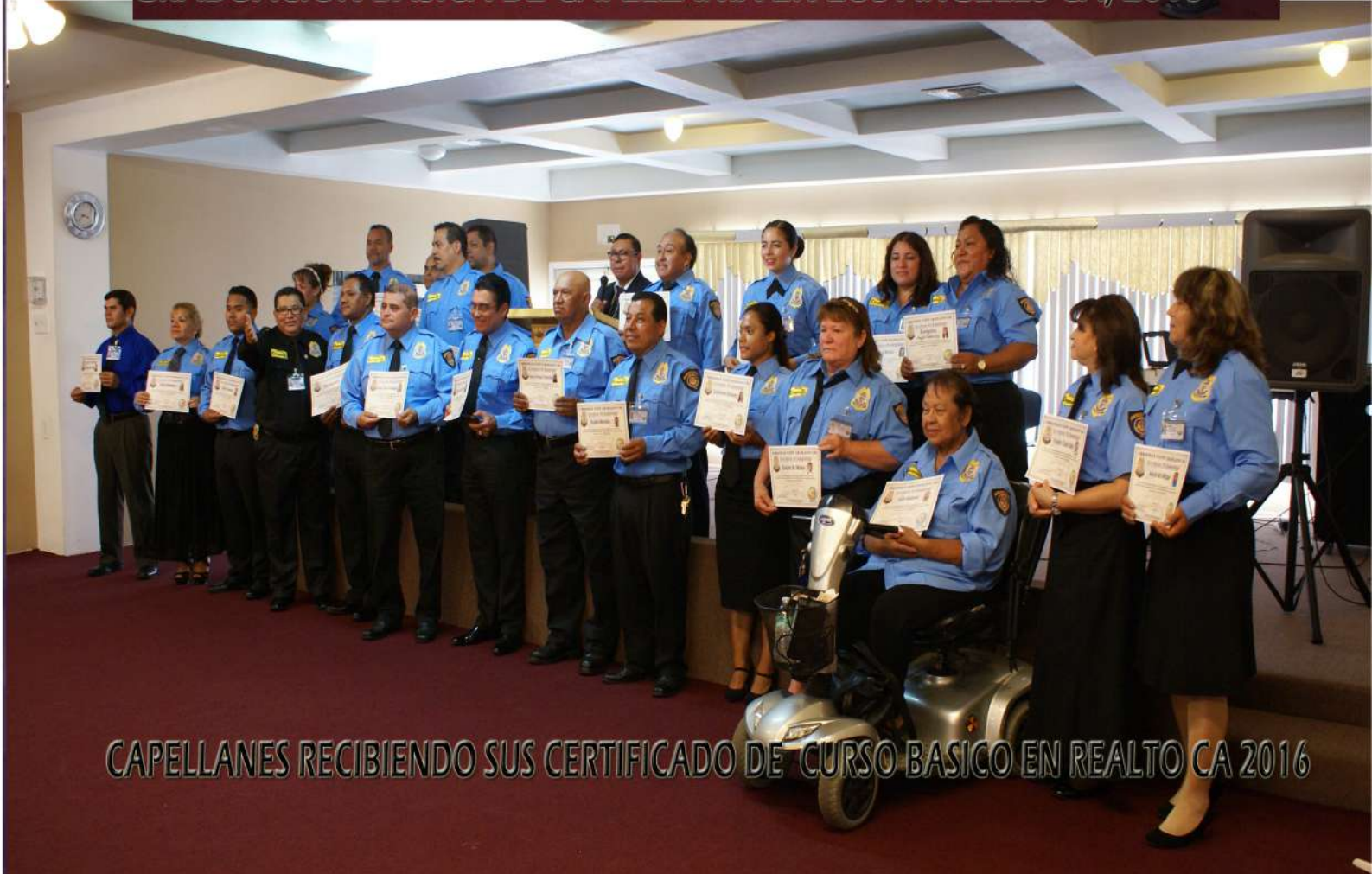
CAPELLANES RECIBIENDO SUS CERTIFICADO DE CURSO BASICO EN REALTO CA 2016